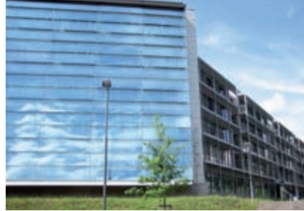
Science Park Saar

Der Science Park 1 wurde im Jahr 2000 eröffnet und bietet 20 Unternehmen mit rund 180 Mitarbeitern Platz. Aufgrund der großen Nachfrage nach Büro- und Laborfläche in unmittelbarer Nähe zum Universitätscampus wurde im Juni 2005 die Erweiterung des Science Park 2 in Betrieb