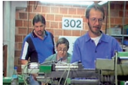
Science Park Saar

Das Ausbildungszentrum Burbach (AZB) ist im gesamten Stadtverband Saarbrücken tätig und bietet mithilfe des ESF z.B. Hauptschulabschlusskurse für Jugendliche und junge Erwachsene ohne Schulabschluss an. Außerdem werden jährlich über 100 Jugendliche ausgebildet als Gärtner, Maler, Lackierer, Elektroinstallateur, Tischler, Koch, Gastgewerbefachkraft, Bürokaufmann, Friseur, oder Einzelhandelskaufmann. Berufsberatungen, Berufsvorbereitende Maßnahmen und Qualifizierungen sind weitere Schwerpunkte.