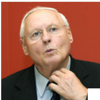
Oskar Lafontaine machte erst die SPD und dann die Linkspartei zu seinem Vehikel, um gegen die Politik Gerhard Schröders zu Felde zu ziehen.

Nur mal angenommen, Oskar Lafontaine hätte recht. Nur mal angenommen, mehr oder weniger alles, was die SPD in den zehn Jahren seit seinem Rücktritt als Parteichef politisch veranstaltet hat, wäre falsch gewesen. Von der Riester-Rente über die Agenda 2010 bis zu den Kriegen im Kosovo und in Afghanistan. Dies alles mal angenommen, könnte man ja auch die Frage stellen, wer es hätte verhindern können?